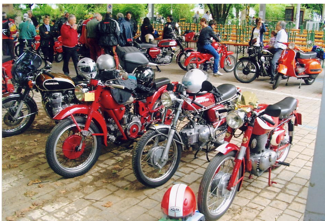
RITROVO A MANDELLO